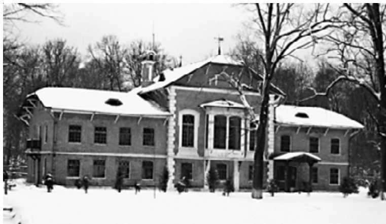
Рис. 1. Кореневский фольварк

Расположенная в 12 верстах от Гомеля Кореневка, будучи приобретенной вместе с другими землями, первоначально была помещьем, в котором находились винокурня и кирпичный завод. На хранящейся в фондах Гомельского областного краеведческого музея карте Гомеля и окрестностей 1838 г. обозначен фольварк Кореневский. Здесь видны