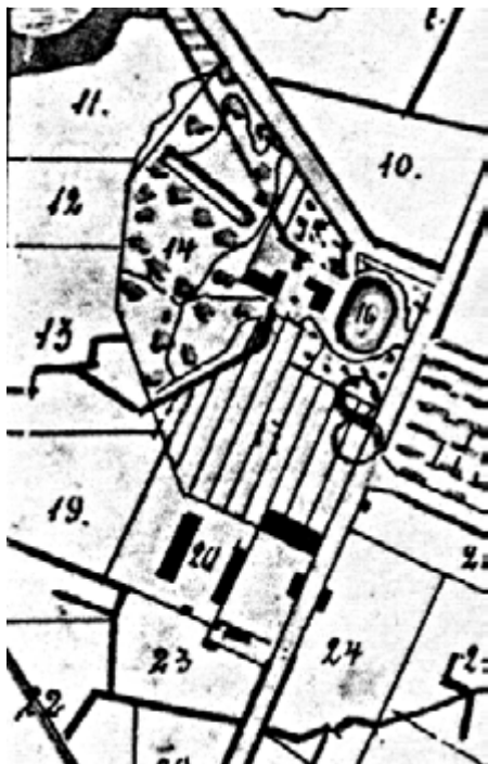
Рис. 2. План Кореневского фольварка

Между 1876 и 1881 гг. на плане дома появляется пристройка со стороны дворового фасада. Так, в деле «Описание лесных дач Кореневского фольварка», начатом в 1881 г., охотничий дом на плане угодий изображен перед прудом и имеет Г-образную форму с выступом на тыльную сторону 10 . В позднейших документах находим объяснение, что дом «получил» каменную пристройку для кухни 11 .