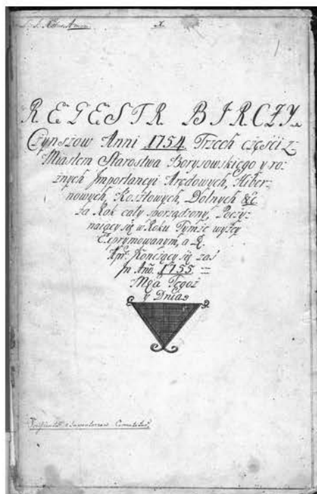
Фота 4. Рээстр збору чынышу па Барысаўскім старостве за 1754 г. (НГАБ. – Ф. 694. – Воп. 2. – Спр. 510).

Беззямельная, ці “шарачковая”, шляхта, аменавіта – чыншавая, якая бестэрмінова арандавала зямлю ў буйных землеўладальнікаў і сама яе апрацоўвала, складала пераважную большасць умоўна адзінага шляхецкага саслоўя і прайшла пад скіпетрам расійскага цара, бадай, найбольш шматпакутлівы і супярэчлівы шлях. У выніку імперскай палітыкі “разбору шляхты” 1830–1860-х гг. адна частка чыншавікоў была зацверджана Сенатам у складзе расійскага дваранства, а другая, якая так і не змагла даказаць свайго шляхецкага паходжання, фармальна была прыпісана да мяшчан ці нават да сялянскіх таварыстваў. У нашым выпадку, адны шляхціцы-чыншавікі радзівілаўскага маёнтка Барысаўшчына (былога Барысаўскага староства) афіцыйна сталі дваранамі Барысаўскага павета (фота 1), другія апынуліся ў складзе мяшчан горада Барысава ці мястэчка Халапенічы, але па-ранейшаму працягвалі пражываць у сельскай мясцовасці. Іх лёс і становішча, у значнай ступені, прадвызначылі тыя абставіны, што ў 1857 г. князь Леан Радзівіл свой маёнтак Барысаўшчына, які яшчэ ў 1797 г. быў падараваны яго дзеду князю Міхаілу Радзівілу (фота 2) імператарам Паўлам I, прадаў вялікаму князю Мікалаю Мікалаевічу Старэйшаму (фота 3) з царскага дому Раманавых [35], а ў 1876 г. гэты маёнтак, ужо пад назвай “Стары Барысаў” (“Стара-Барысаўскі маёнтак”), быў набыты Міністэрствам дзяржаўных маёмасцяў