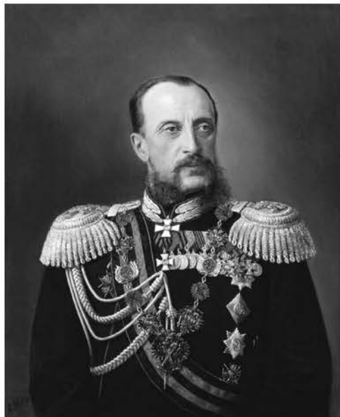
Фота 3. Вялікі князь Мікалай Мікалаевіч Старэйшы (1831–1891), уладальнік маёнтка Барысаўшчына Барысаўскага павета Мінскай губерні з 1857 г.

[17] і лічыўся казённым да 1899 г., калі зноў перайшоў ва ўласнасць вялікіх князёў Раманавых [16]. Таму ў дачыненні да чыншавых шляхціцаў Стара-Барысаўскага маёнтка ў час падрыхтоўкі і рэалізацыі чыншавай рэформы 1886 г., які прыпаў менавіта на перыяд знаходжання маёнтка ў казённым валоданні, праводзіліся мерапрыемствы як да зыхароў дзяржаўных зямель, што, бадай, толькі ўскладняла іх становішча і яшчэ хутчэй набліжала іх да трагедыі абеззямельвання.