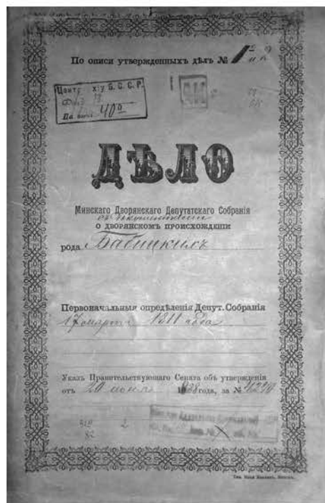
Фота 1. Справа Мінскага дваранскага дэпутацкага сходу аб дваранскім паходжанні роду Бабіцкіх герба “Даленга” (НГАБ. – Ф. 319. – Воп. 2. – Спр. 82).