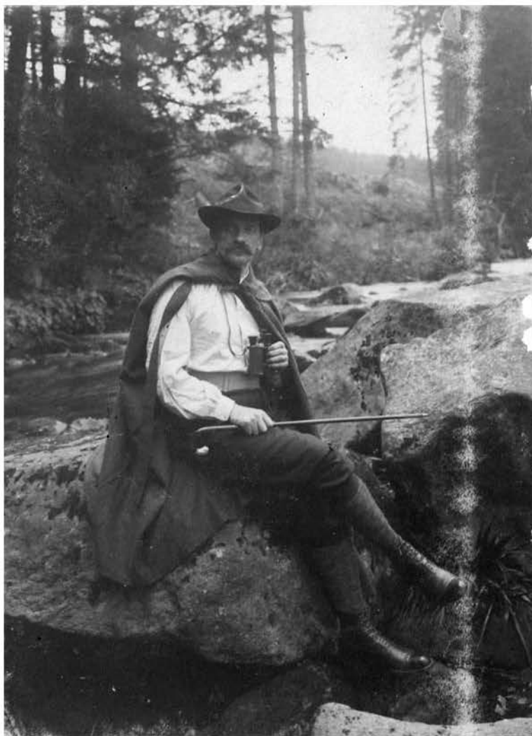
Фота 7. Карл Іосіфавіч Свяцікі (1866–1929), уладальнік ма- ёнтка Крупка Сенненска- га павета Магілёўскай губерні з 1877 да 1918 гг. Надпіс пад фотаздымкам: “Na wusieczce: K. Swiacki rok 1911” (з сямей- нага альбома Свяцікіх).

Барысаўшчына – былым Барысаўскім старостве – карысталіся зямлёй спрадвек, калі яшчэ афіцыйна належылі да шляхецкага саслоўя. Сенатам жа род Крачкоўскіх так і не быў зацверджаны ў дваранстве, і галіна Іллі Данілавіча з Маласаяў паводле ўказа Мінскай казённой палаты ад 14 студзеня 1865 г. была прылічана да “граждан горада Барысава” [33, арк. 102–102 адв.], а пазней, паводле ўказа той жа палаты ад 31 снежня 1870 г., пералічана да “мяшчан-хрысціян горада Барысава” [39, арк. 60 адв.–61]. У саслоўі барысаўскіх мяшчан прадстаўнікі гэтай галіны, увесь час пражываючы ў сельскай мясцовасці, знаходзіліся аж да 1917 г. Бацька Іллі Крачкоўскага – Данііл Ксавер’евіч – зафіксаваны ў ліку “чыншавага шляхецтва” як у рэвізскай сказцы ад 28 студзеня 1816 г., калі ён жыў яшчэ ў вёсцы Стайкі на фондушовай зямлі свя-