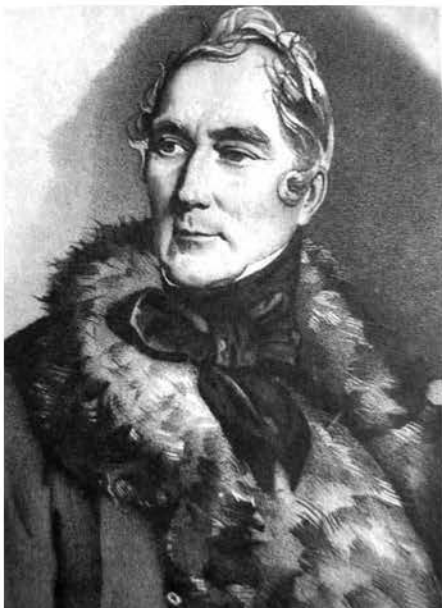
Фота 2. Князь Міхаіл Геранім Радзівіл (1788–1850), уладальнік маёнтка Барысаўшчына Барысаўскага павета Мінскай губерні з 1797 г.