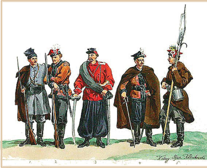
Польские повстанцы 1863 года. Художник Валери Элиаш-Радзиковский