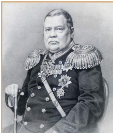
Михаил Николаевич Муравьев-Виленский