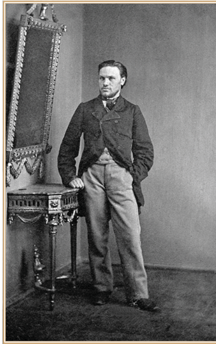
Викентий Константин (Кастусь) Семенович Калиновский

и «Белорусской энциклопедии» 10 . Ему же принадлежит заслуга в популяризации тематики восстания в периодической печати, например, в республиканских газетах «Голас Радзімы» (рус. — «Голос Родины») и «Роднае слова» (рус. — «Родное слово») 11 . Несколько статей, преимущественно о страницах биографии К. Калиновского, опубликовал Вячеслав Шалькевич 12 .